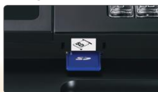
Lecteur carte SD